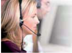
Risponditore di cortesia personalizzabile