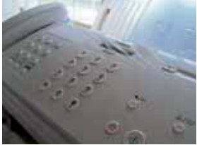
Riconoscitore automatico Fax