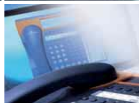
Interazione con le principali funzioni del PC grazie all'uso di ST600