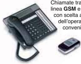
Chiamate tramite linea GSM e FISSA con scelta automatica dell'operatore più conveniente